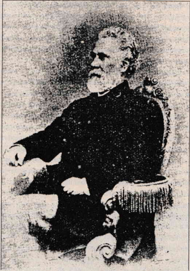
Ion I. Brătianu, 1821 - 1891