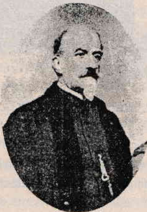
Generalul Nicolae Golescu, 1810 - 1887

În aceeași zi, 11 februarie 1866, Camera și Senatul, întrunite în sala de ședințe a Adunării Deputaților sub președinția Mitropolitului Primat, în urma propunerii lui Ion Ghica, aleg prin aclamații ca «Domn stăpânitor al Principatelor-Unite Române» pe «Alteța sa Regală Filip Eugeniu Ferdinand Maria Clement Balduin Leopold George, Comite de Flandra și Duce de Saxonia, sub numele de Filip I».