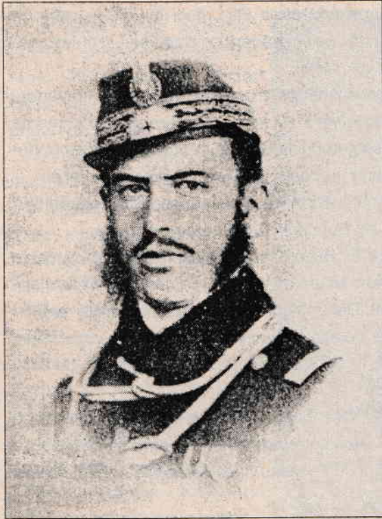
Domnitorul Carol în uniformă de ofițer român