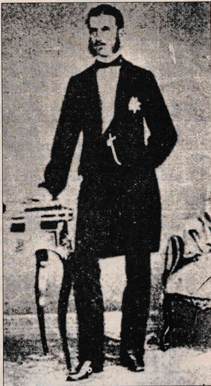
Principele Carol de Hohenzollern

Alegerea Contelui de Flandra nemulțumise nu numai Turcia, Rusia și Austria ci și pe Napoleon al III-lea.