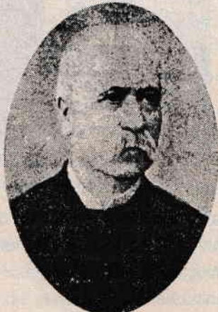
Lascăr Catargi, 1823 - 1900