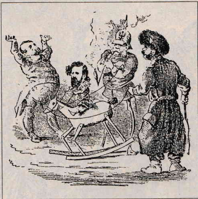
O poticnire politică externă: Ion Brătianu care ar vrea să meargă înainte, este ținut cu sfori de Germania și de Ruși, spre disperarea lui Napoleon III (caricatură din 1869)

Congresul de la Berlin (13 iunie -13 iulie 1878), admite Independența României dar în același timp primește punctul de vedere rusesc, legalizează răpirea celor trei județe din Basarabia, dându-ne Dobrogea în schimb. Și indepen-